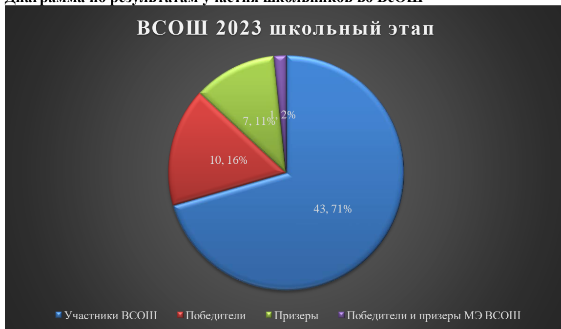
Диаграмма по результатам участия школьников во ВсОШ

В 2023 году был проанализирован объем участников конкурсных мероприятий разных уровней. Дистанционные формы работы с учащимися, создание условий для проявления их познавательной активности позволили принимать активное участие в дистанционных конкурсах регионального, всероссийского и международного уровней. Результат – положительная динамика участия в олимпиадах и конкурсах, привлечение к участию в интеллектуальных соревнованиях большего количества обучающихся Школы.